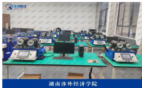
湖南涉外经济学院